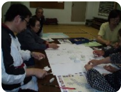
＝野母崎樺島地区公民館

この問題をどうにかしようと、座談会に参加した有志はその後何度も会議を重ねて、樺島の入口に「観光案内板（観光マップ）」を建てようという目標を定め、地元行政センターにも加わって、その実現に向けて動き始めました。