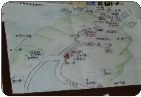
手書きの原案図です！上手かね～！

平成22年3月に野母崎樺島地区で住民座談会が開催されました。この座談会では、生活の困りごとの中に、外ナンバーの車が道に迷って「樺島灯台へは、どう行くのですか？」とよく道を尋ねられて困るとの声が多くあがりました。