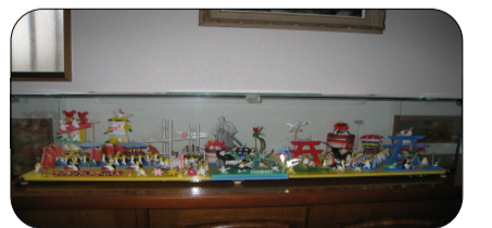
廃品も上手に利用して作ります

最後に活動を続けていく秘訣は？と尋ねると、「考えたり、手を動かすことによって認知症の防止になるし、いろいろな人と話すことが楽しい。そして、自分自身が楽しく過ごせる『居場所づくり』ですよ」と、満面の笑顔で話してくださいました。