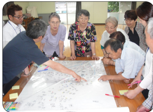
ここはどがんなか～！＝白木公民館

で策ば考えんばいかなね」という前向きな意見もたくさん聞くことができた。マップ作りは現在進行中で、完成した後にはどんな活動が生まれるのか楽しみでです。