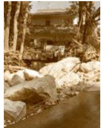
（豪雨により被害を受けた家屋）

ボランティアの方々による災害支援と併せて、災害義援金への協力など、引続き被災地の復興に向けたご協力をお願いいたします。