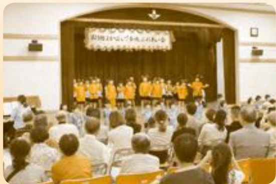
よかばい香焼ふれあい会

また、2箇所のデイサービスセンターにおいて、地域に開かれた事業所を目指すために、地域住民と連携・協力のもとに様々な地域貢献事業に取り組んでいます。