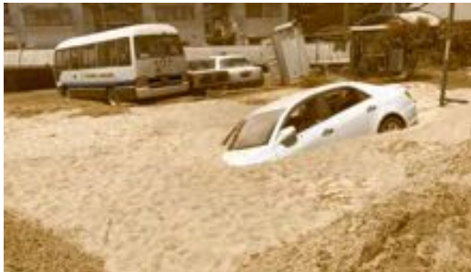
（土砂に埋もれた車両）

平成30年7月豪雨災害の被災者支援のために、岡山・広島・愛媛県内の被災地の社協において災害ボランティアセンターが設置されました。