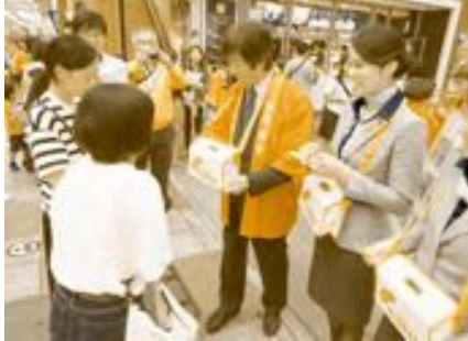
(赤い羽根共同募金街頭募金の実施)