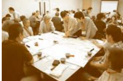
(やってみゅ〜でわがまち座談会の開催)