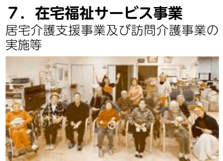
(通所介護事業・地域密着型通所介護事業の実施)