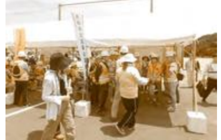
(災害ボランティアセンター運営訓練の実施)