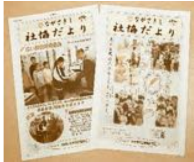
(社協だよりの発行)