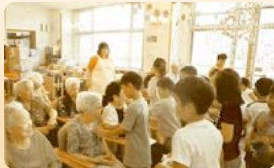
小学生とのデイサービス交流事業

各自治会や民生委員、ボランティアの皆さんのご協力のもとに、仲間づくりや健康増進を目的とした地域デイ交流会を年1回、各地区で開催しています。