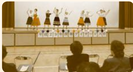
深堀デイサービス祭り