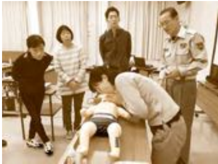
(ファミリーサポートセンターながさき推進事業の実施)