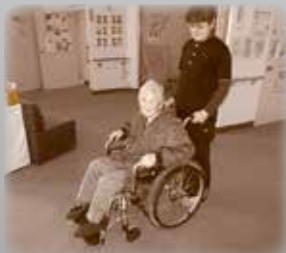
在宅生活を支える 車椅子の購入に