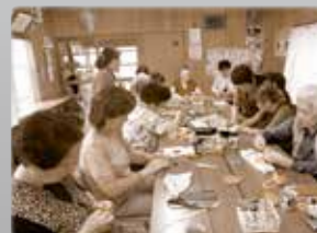
高齢者の生きがいと 居場所づくりの活動に