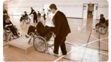
(福祉体験学習等への支援)