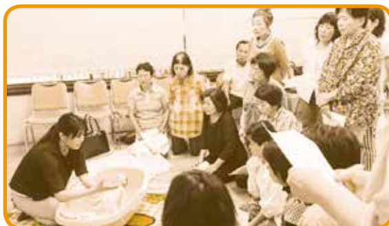
赤ちゃんの沐浴の練習

ファミリー・サポート・センターながさきでは、「子育ての援助をしたい」まかせて会員の養成を目的とした研修会を年3回開催しています。今回、第2回まかせて会員養成研修会を開催いたします。興味をお持ちの方がおられましたら、下記までお気軽にお問い合わせください。