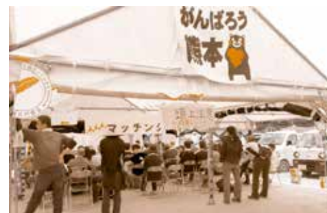
(熊本県益城郡益城町)

体力が必要な仕事も多いですが、老若男女を問わず4月のセンター開設から8月初旬までで延べ30,000人以上の方にご協力をいただき、中には1日に3回、4回と活動に参加くださる方もおられました。1日も早い復興を願いながら、私達としましても出来る限りの協力をしたいと思っています。