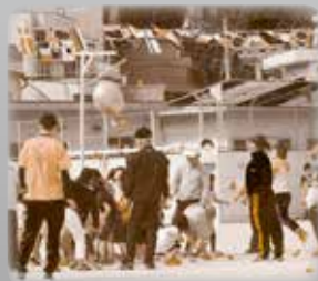
住民同士の交流や 絆づくりに