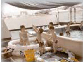
安全・安心な 遊び場づくりに

温かいご協力ありがとうございました！ お寄せいただいた募金は、有効に活用させていただきます。