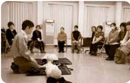
(ファミリー・サポート・センター ながさき推進受託事業の実施)