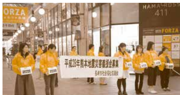
(長崎市社協職員による街頭募金)

平成28年4月23日(土)、浜町のハマクロス411前にて長崎市社協職員で「平成28年熊本地震災害」への義援金募集の街頭募金を行いました。