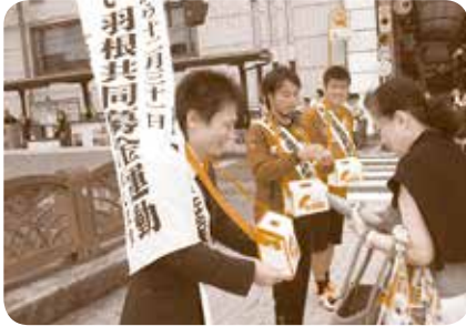
(赤い羽根共同募金街頭募金の実施)