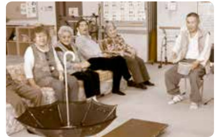
(通所介護事業の実施)