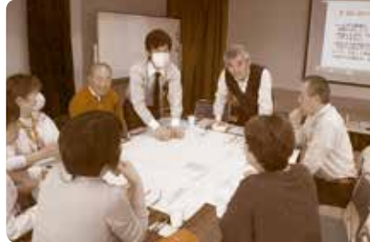
(やってみゅ〜でわがまち座談会の開催)