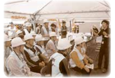
(災害ボランティアセンター訓練の様子)

市民の皆様が、普段感じている社協活動や地域福祉活動への疑問などにお応えするコーナーです。今回は長崎市社協が行っている「災害ボランティアセンター」についてお応えします。