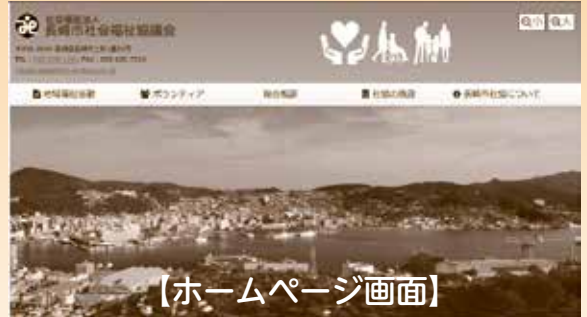
【ホームページ画面】

社協のホームページでは社協の組織や業務内容、制度変更による重要なお知らせを掲載しています。情報は随時更新しておりますのでぜひご覧ください。