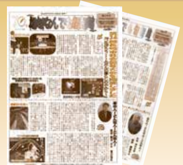
【地域なんでも情報局】

さまざまな地域の情報や人物紹介などを載せて、年4回発行しています。6、9、12、3月に社協支部長のところに届けられ、自治会掲示板などに掲示されている地区もあります。本紙は社協のホームページでもダウンロードできますので、ぜひホームページにアクセスしてみてください。