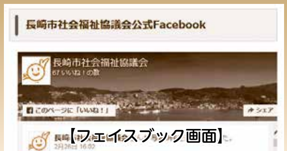
【フェイスブック画面】

社協フェイスブックでは、社協が実施している行事や地域の取り組みをリアルタイムで発信しています。ぜひ、「いいね!」を押して情報をゲットしてみてください。