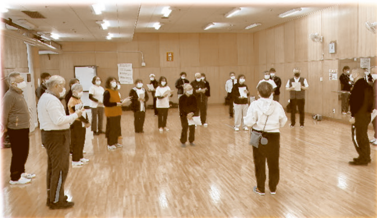
【リハーサルの様子】