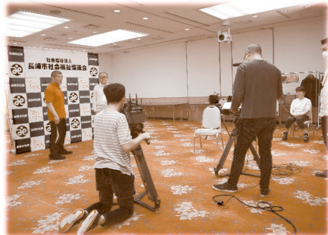
⇒6ページでもご紹介しています!