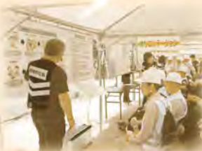
↑年に1回開催する訓練の様子